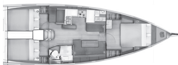
Версия С Носовая мастер-каюта 2 кормовые каюты / 1 туалет Гардероб + отдельная раковина в носовой каюте как опция