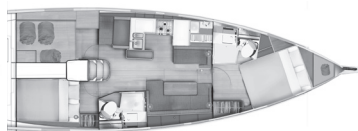
Версия В Носовая мастер-каюта 1 кормовая каюта / 2 туалета