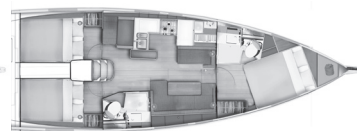
Версия D Носовая мастер-каюта 2 кормовые каюты / 2 туалета

Гардероб + отдельная раковина в носовой каюте как опция