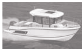
Merry Fisher 795 marlin